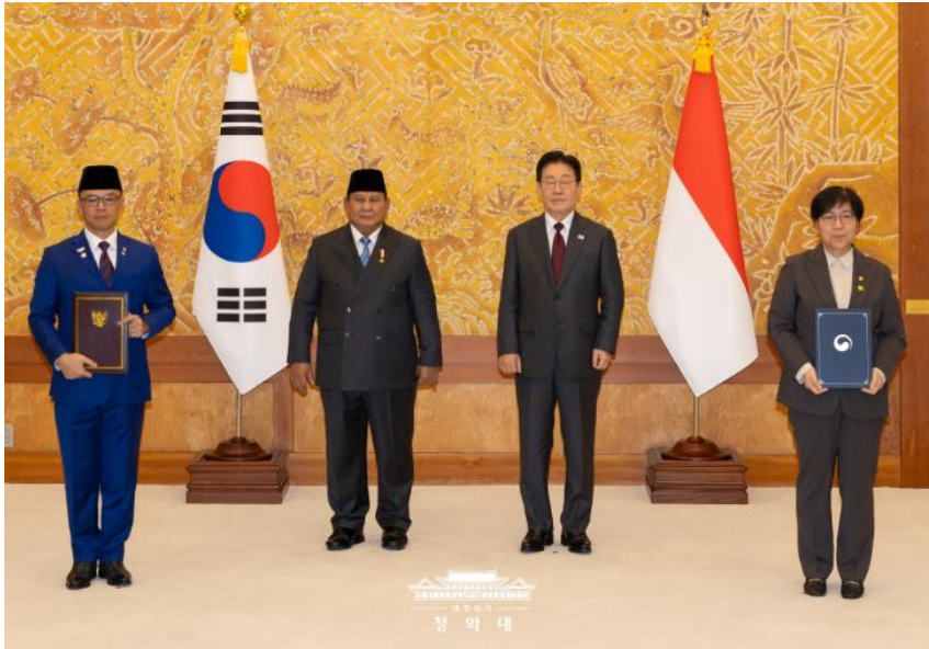
국민 방문중인 프라보워 수비안토 인도네시아 대통령과 이재명 대통령이 정상회담 후 양해각서를 교환하고 있다.

경제·방산·AI·핵심광물 등 총 16건의 MOU 체결, 실질적 협력 기반 강화